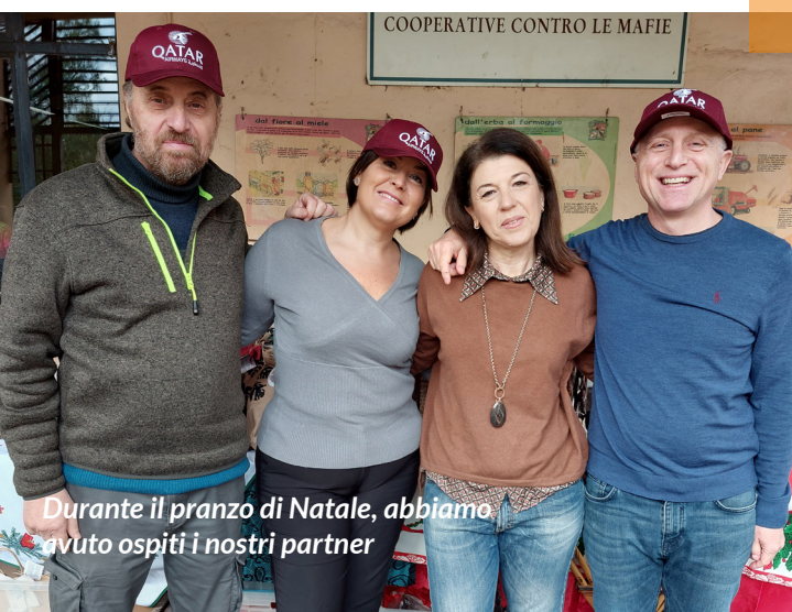
Durante il pranzo di Natale, abbiamo avuto ospiti i nostri partner