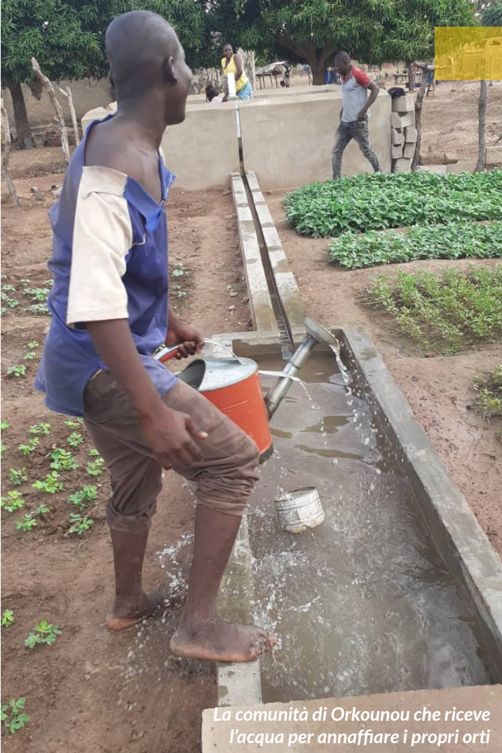
La comunità di Orkounou che riceve l'acqua per annaffiare i propri orti