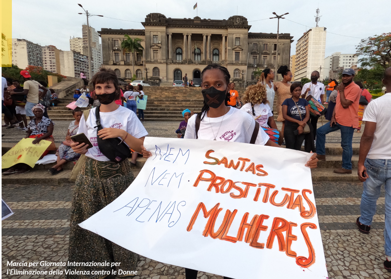
Marcia per Giornata Internazionale per l'Eliminazione della Violenza contro le Donne

sostegno finanziario, promuove la conoscenza e l'applicazione delle leggi esistenti contro la violenza di genere e crea opportunità per l'effettivo empowerment di donne e ragazze: questo modello si è dimostrato efficace nel ridurre l'incidenza della violenza nelle comunità e nel creare una rete di sostegno per le donne vittime di violenza familiare.