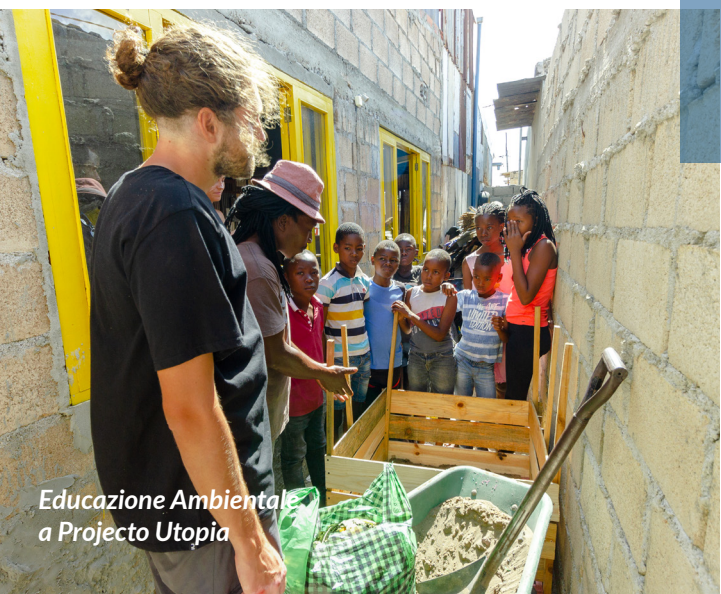
Educazione Ambientale a Projecto Utopia

Scopri il Servizio Civile Universale su www.agapeets.org/servizio-civile-universale/