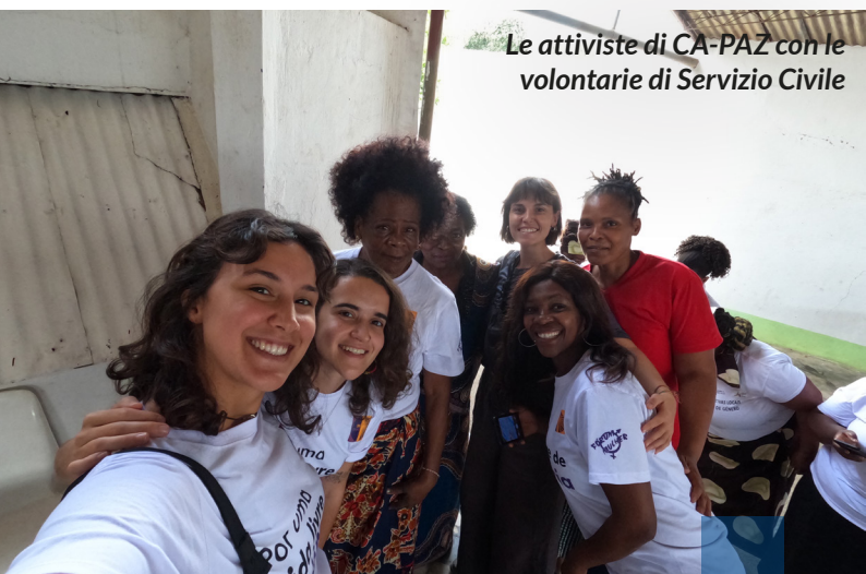
Le attiviste di CA-PAZ con le volontarie di Servizio Civile

Con 18 anni di esperienza, più di 40 volontari sul campo, oltre 5000 persone assistite, CÁ-PAZ interviene in tutti gli aspetti che contribuiscono al benessere della persona, guardando l'individuo all'interno del suo contesto familiare e comunitario: ogni giorno l'associazione contribuisce al rafforzamento e all'indipendenza delle donne della comunità attraverso lo strumento del