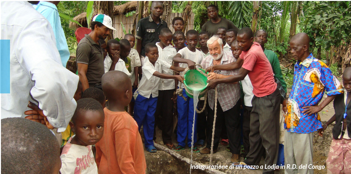
Inaugurazione di un pozzo a Lodja in R.D. del Congo