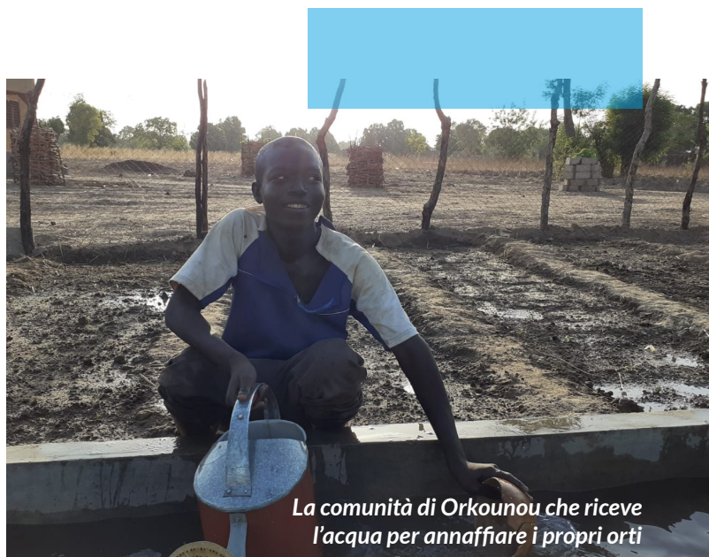
La comunità di Orkounou che riceve l'acqua per annaffiare i propri orti