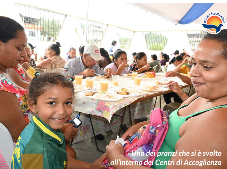
Uno dei pranzi che si è svolto all'interno dei Centri di Accoglienza

DA QUEST'ANNO CI APRIAMO A UN ALTRO PAESE GRAZIE AL PROGRAMMA DI SERVIZIO CIVILE E ALLA DISPONIBILITÀ E ALLA COMPETENZA DELLE SUORE SCALABRINIANE DI QUITO