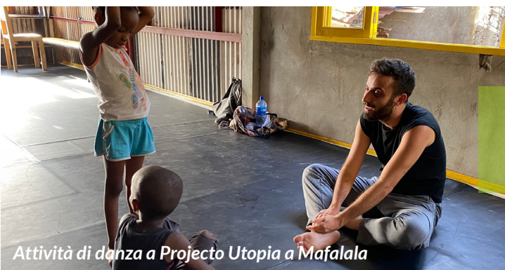
Attività di danza a Projecto Utopia a Mafalala

AGAPE ha sempre fatto parte, in un modo o nell'altro, della mia vita. Essendo quasi coetanei, siamo cresciuti assieme e durante gli anni l'ho vista strutturarsi, migliorarsi ed evolversi, sempre dando priorità assoluta alla sua missione. Con buona parte della famiglia coinvolta attivamente all'interno dell'associazione, mi è stata fatta più e più volte la domanda: "e tu quando parti in missione?" come se dovessi partire per seguire un preciso schema logico. Ho aspettato un po' prima di farlo, affinché fosse una scelta ponderata e consapevole, ma soprattutto funzionale per l'associazione e per le persone che avrei incontrato. Con il senno di poi, sono felice di averlo fatto.