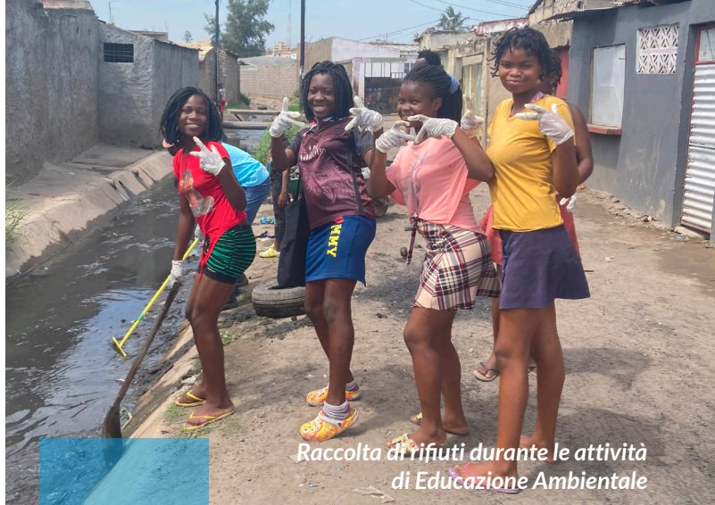
Raccolta di rifiuti durante le attività di Educazione Ambientale

Le organizzazioni in cui quest'anno i ragazzi italiani hanno potuto svolgere la loro attività di volontariato a contatto con i bambini sono state ben otto, a conferma di quanto l'associazione sia sempre più conosciuta sul territorio e si stia guadagnando la fiducia sia delle altre associazioni locali, quanto delle istituzioni pubbliche. Tra di queste ci sono le tre organizzazioni in cui è attivo il SAD, ovvero l'Associazione Machaka, A.V.I.M.A.S. e il CRPS de Mahotas, ma anche Casa Esperança, l'orfanotrofio che si trova a Katembe, subito fuori il centro di Maputo, l'Associazione Hlayiseka, che si occupa di bambini di strada e a rischio, due scuole speciali che si occupano di bambini disabili e con cui abbiamo iniziato proprio quest'anno a lavorare, e Projecto Utopia, una nuova realtà del quartiere di Mafalala, lo stesso dell'Associazione Machaka.