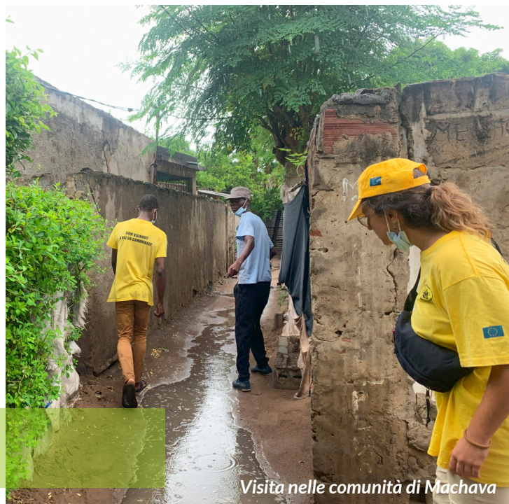
Visita nelle comunità di Machava

Dall'esperienza acquisita nell'applicazione dell'IPC, questo approccio è sfociato in un modello formale denominato "Buon Vicino" (Bom Vizinho), con l'obiettivo di trasformare i membri della comunità in agenti di cambiamento, responsabili della soluzione dei problemi sociali del quartiere e del miglioramento delle condizioni di vita.