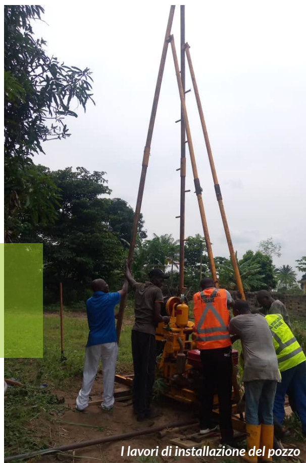
I lavori di installazione del pozzo

Al resto della comunità attorno alle scuole, cerchiamo di vendere l'acqua ad un prezzo sociale, così da ricavare il necessario per mantenere le cisterne e la pompa di acqua in buone condizioni. Prima che venisse realizzato il pozzo, l'acqua che veniva utilizzata per bere e lavarsi era quella dei corsi d'acqua locali, spesso contaminati da rifiuti, batteri e agenti chimici o dall'acqua piovana stagnante, che, per questa ragione, non poteva rispettare i requisiti minimi di igiene e salubrità, e costituiva una delle fonti principali di diffusione di malattie infettive e di gravi patologie renali e gastrointestinali.