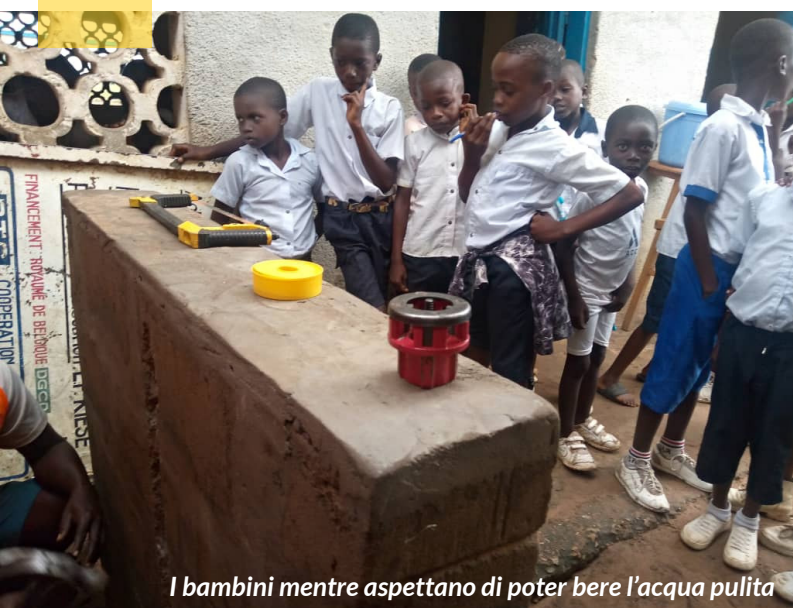
I bambini mentre aspettano di poter bere l'acqua pulita

La presenza di acqua pulita in questo luogo ha cambiato molto la vita dei bambini della zona: invece di dover fare ogni giorno 5 chilometri sotto il sole cocente, con carichi disumani sulla testa, per prendere solo 5 litri di acqua pulita, adesso la possono trovare vicino casa costantemente. Grazie all'utilizzo dell'acqua pulita del pozzo, scenderà di molto il tasso di mortalità infantile, quello dei bambini di strada e anche la scuola non dovrà più comprare l'acqua per averne di non contaminata. Durante i mesi di luglio, agosto e settembre la comunità potrà utilizzare l'acqua del pozzo per irrigare i campi e coltivarli ugualmente, anche se si tratta del periodo più secco dell'anno. Grazie di cuore per la vostra generosità. Speriamo di poter, in futuro, costruire un nuovo pozzo per raggiungere ancora altri bambini.