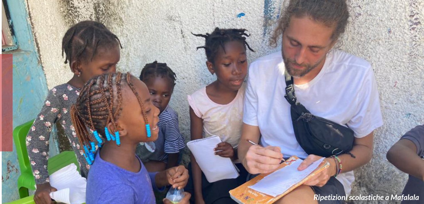
Ripetizioni scolastiche a Mafalala