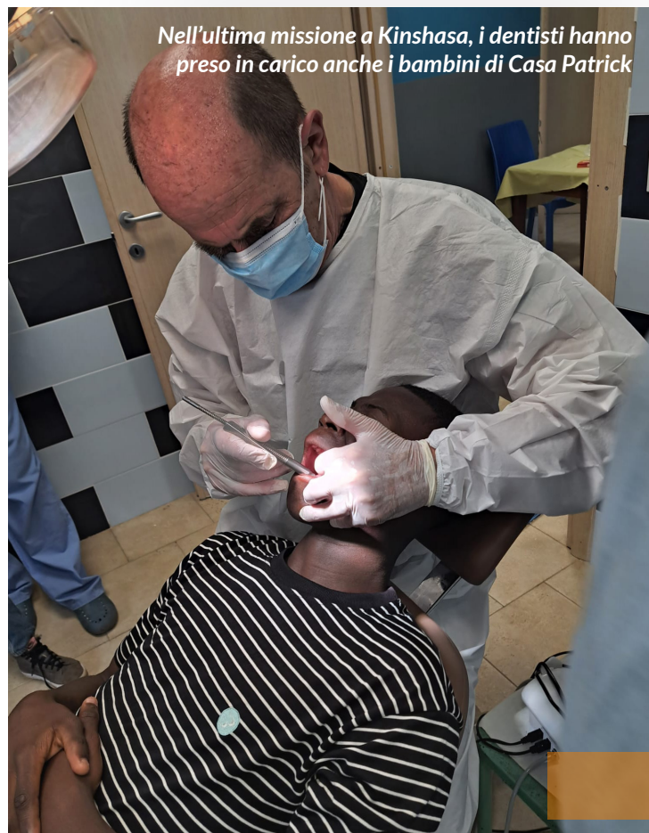
Nell'ultima missione a Kinshasa, i dentisti hanno preso in carico anche i bambini di Casa Patrick

Il programma di Sviluppo Integrato include invece tutte quelle attività definibili come profit che hanno come obiettivo creare opportunità di lavoro per i giovani i cui prodotti e/o utili vanno però ad alimentare progetti degli altri programmi dopo aver coperto i propri costi. Il progetto in corso più importante di questo programma è rappresentato dall'impianto di produzione dell'alga spirulina per la lotta alla malnutrizione rivolto all'imprenditorialità femminile.